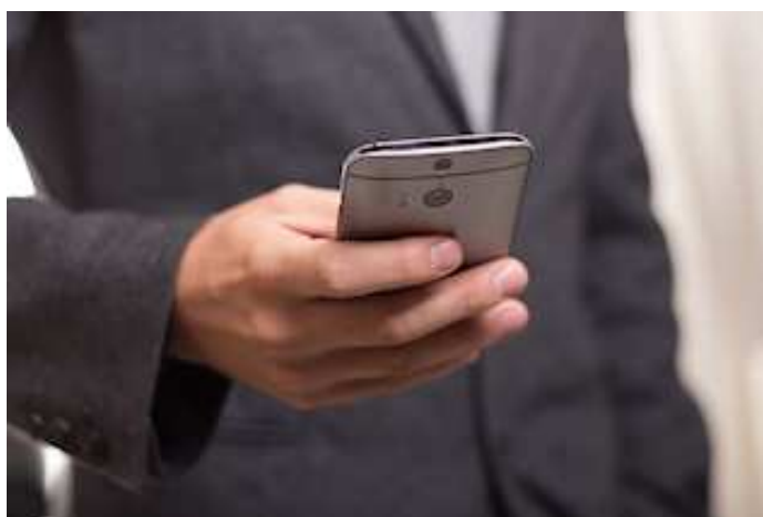
ELO QuickScan 11